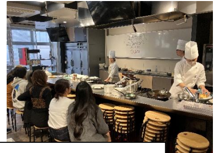
R7 職業体験学習から（左：美容・理容 右：調理・製菓）