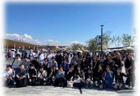
R7 修学旅行：大阪万博で