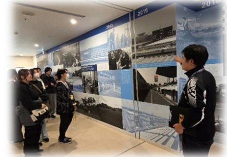
会津・いわき合同で震災復興学習